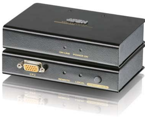
CE250 AR (Remote unit)