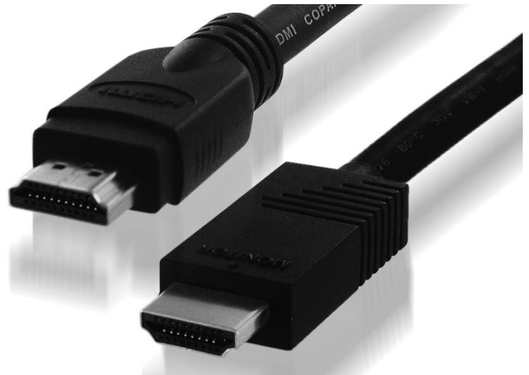
HDMIケーブルとして、一般に入手が困難なサイズ(長さ・太さ)をラインアップしている

全6機種：5m( 4.0mm ), 10m( 5.5mm ), 15m( 7.5mm ), 20m / 25m / 30m( 8.5mm )